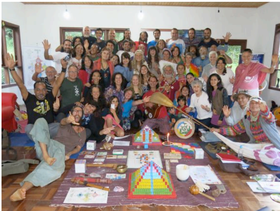
Evento in Brasile: Kin 13; Viandante del Cielo Cosmico Rosso